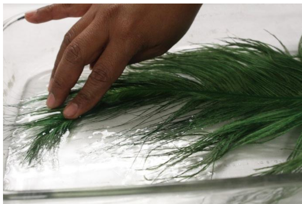
Foto 6. Limpieza acuosa por inmersión en plumas rizosas; fotografía: Ivette García Arreola, 2011.

Los plumones y filoplumas de gallo y pollo fueron tratados también con el mismo detergente no iónico pero sin el uso de propilenglicol ya que la mayoría de ellas habían sido teñidas en la manufactura y esta sustancia las hacía perder el poco tinte que aún conservaban. Para estos casos se aplicó el agente limpiador con hisopo rodado y se hicieron dos enjuagues con el mismo método.