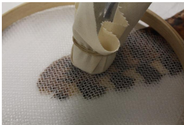
Foto 4. Limpieza mediante aspirado con malla; fotografía: Ivette García Arreola, 2011.

En su investigación de conservación de arte plumario en 1983, Moreno menciona el empleo de lienzos suaves para retirar el polvo de la superficie y el uso de una pluma limpia para limpiar una sucia (Moreno Guzmán, 1983:173). Este procedimiento se ha usado en el Seminario Taller de Textiles de la ENCRYM con buenos resultados para los mosaicos de plumas, 3 también se ha usado en el Museo Británico.