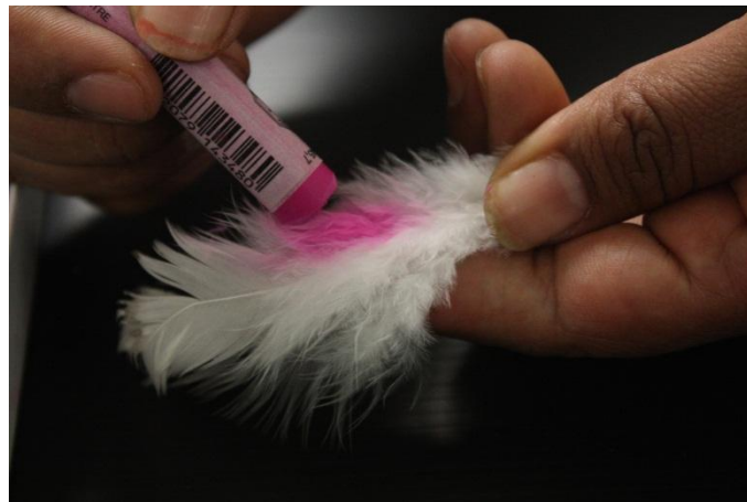
Foto 7. Reintegración cromática con pinturas al pastel en plumones; fotografía: Ivette García Arreola, 2011.

Las plumas esponjosas que habían sido teñidas artificialmente durante su manufactura habían perdido su colorido por acción de la luz y, por lo tanto, no era posible apreciar su simbolismo, especialmente en los plumones de pollo y las plumas de avestruz. Después de varias pruebas, se determinó que la reintegración cromática se realizaría en un tono cercano al que aún conservaban de las secciones menos degradadas y que correspondían al color en las zonas que no estuvieron expuestas directamente a la luz, por ejemplo, a la altura del cálamo cuando el cosido de plumas en la entretela protegió el nacimiento del vexilo. Con ese objetivo en mente se aplicaron pinturas al pastel (ver Foto 7) y se usó almidón en aerosol como fijativo, de forma similar a como se hace la reintegración de color en listones en el Seminario Taller de Textiles de la ENCRyM.