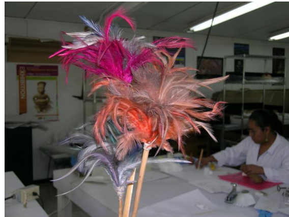
Foto 1. Técnica de inserción de plumas. Detalle de tocado ceremonial Tarahumara, estado de Chihuahua; fotografía: Samira Macías Flores, 2011

combinaron; por ejemplo, cosido con amarrado, como en los sopladores o los cetros (ver Foto 2).