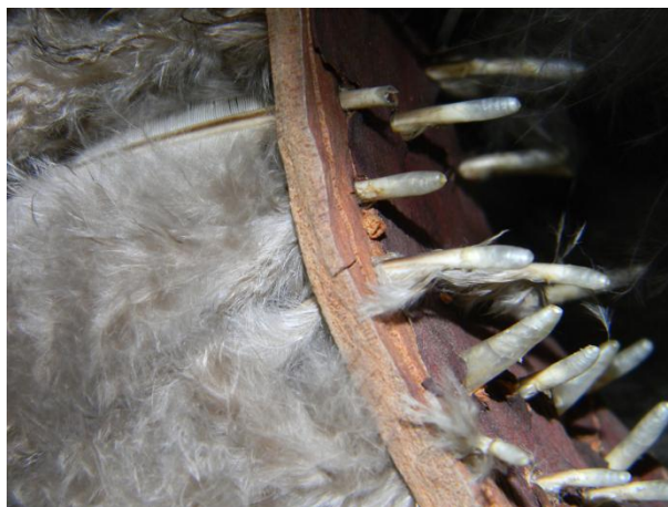
Foto 3. Plumas con raquis flexible. Detalle de la parte superior de un cetro ceremonial usado por el pueblo indígena Yaqui del estado de Sonora; fotografía: Ivette García Arreola, 2011.

Antes de comenzar a trabajar los objetos seleccionados para la muestra, era necesario conocer las características generales de las plumas para prever la forma en la que se comportarían ante distintas sustancias que podrían emplearse para incidir en ellas. A continuación resumiremos la información que fue fundamental para generar la propuesta de intervención, así como datos acerca del estudio en el comportamiento de las aves que fue determinante para comprender cómo la polaridad 2 de los agentes limpiadores influye directamente en el resultado por tipo de pluma al momento de limpiar.