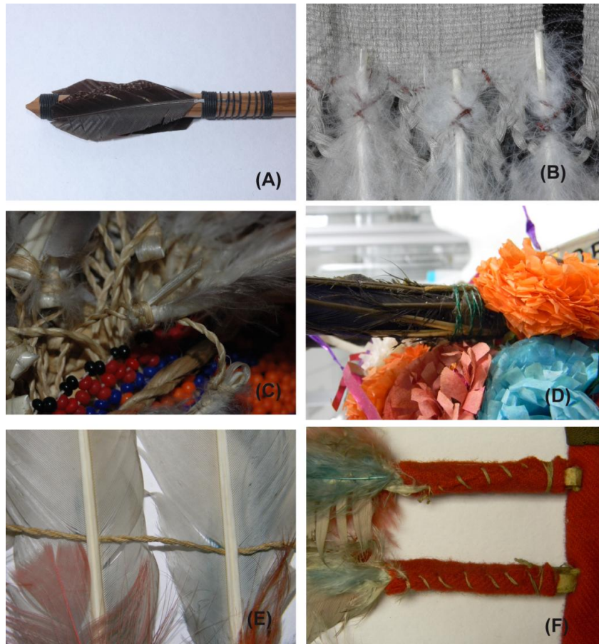
Foto 2. Detalle de piezas de diversos pueblos indígenas de México y Norteamérica; (A-D) Técnica de amarrado y mixtas, (E y F) Técnica de cosido y mixta; fotografías: Diego Nahin Cortés Villanueva y Samira Macías Flores, 2011