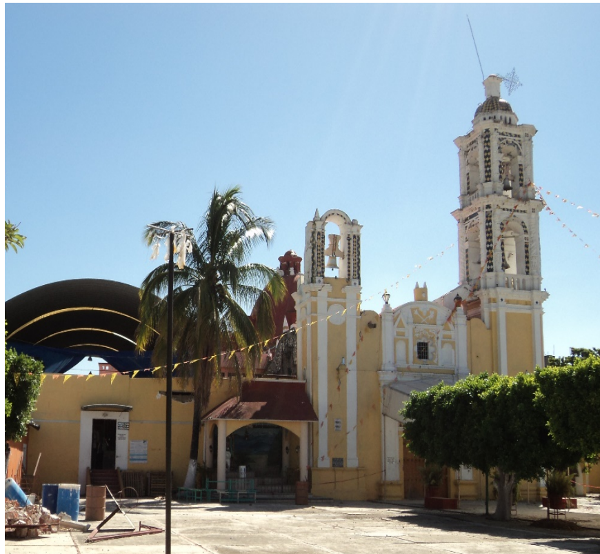
Figura 1. Vista General de la Parroquia de Santiago Apóstol en Izúcar de Matamoros,

Izúcar de Matamoros es una ciudad ubicada en el estado de Puebla. En ella se ubica la Parroquia de Santiago Apóstol que fue construida por los franciscanos, lugar donde se venera como santo patrono al conjunto escultórico que representa al Apóstol Santiago, en su advocación conocida como Santiago Matamoros ataviado con armadura y montando sobre un corcel blanco. Llamado cariñosamente “Santiaguito” por sus devotos, es una imagen considerada por varias generaciones como milagrosa, a la vez que protectora de la comunidad de Izúcar, razón por la cual miembros de su comunidad lo resguardaban y cuidaban de manera especial.