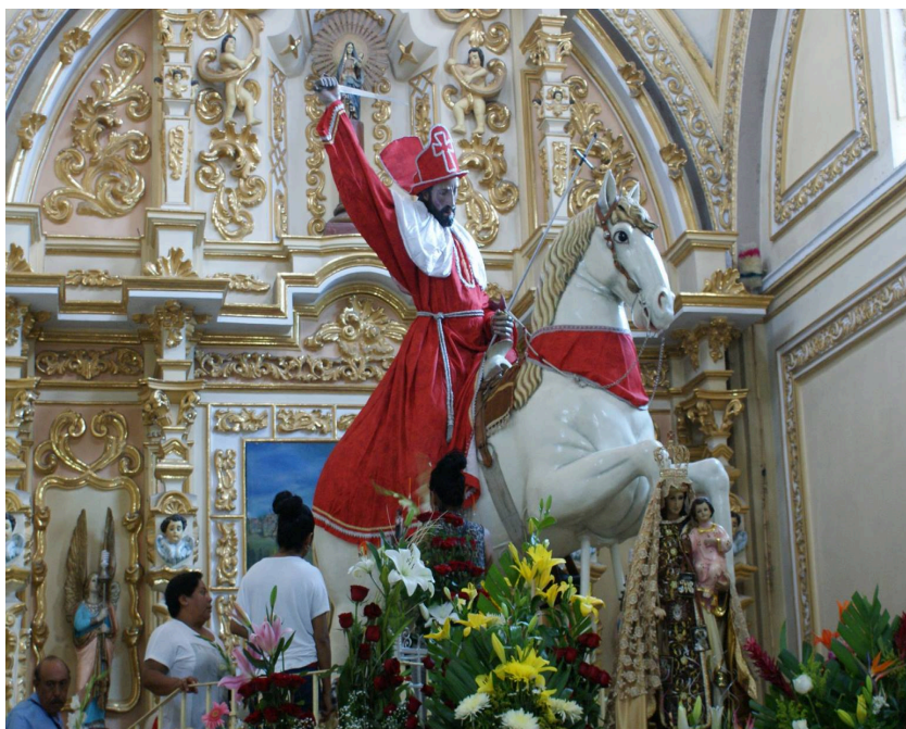
Figura 2. Vista general del Conjunto Escultórico de Santiago Apóstol antes del sismo

Además de la importancia devocional que tiene el conjunto escultórico posee gran relevancia estética y tecnológica; la figura de Santiago es una escultura ligera elaborada aproximadamente a finales del siglo XVI con una variante de la técnica de papelón (construida a partir de tubos de papel, cañuelas y pasta de caña de maíz), recubierta con una policromía rica en detalles. El corcel, de factura cercana al siglo XIX, fue construido y tallado sobre una estructura de madera con armazón de metal; los detalles del volumen y los terminados se elaboraron en talla directa sobre madera que posteriormente fue policromada. Este conjunto fue posiblemente utilizado de forma procesional; sin embargo, en algún momento la comunidad decidió fijarlo a una base de mampostería en el presbiterio del templo, donde los devotos podían acceder para orar, agradecerle o pedirle favores o dejar alguna ofrenda.