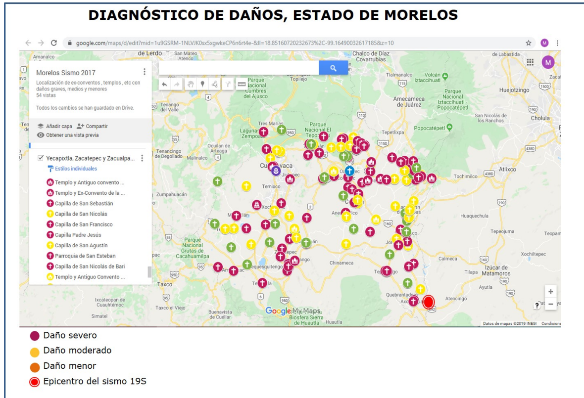
Figura 1. Mapeo de daños por el sismo del 19 de septiembre de 2017 en el Estado de Morelos.