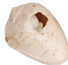
Figura 2. Caracol al terminar los procesos de intervención. Proyecto Arqueológico Cerro del Teúl.

Por su parte, las teselas son en su mayoría de forma rectangular y en menores cantidades cuadradas, trapezoidales, circulares, irregulares y algunas semitubulares (Figura 1). Para su elaboración fueron utilizadas conchas de bivalvos como materia prima (Suárez, 1974). El proceso de factura consistió en cortar por desgaste o percusión las valvas para obtener las piezas del tamaño deseado para finalmente dar la forma deseada mediante desgaste según el lugar que ocuparían en el mosaico (Velázquez, 2007). Este último probablemente tuvo una forma cuadrada o rectangular, de 20 a 25cm por lo menos en un lado. La mayor parte de las teselas encontradas conformaban parte del perímetro a