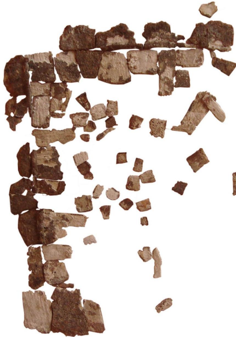
Figura 9. Mosaico armado al finalizar la intervención. Proyecto Arqueológico Cerro del Teúl.

Finalmente, una vez que los objetos pudieron ser manipulados, se realizó el armado del mosaico con las piezas originales siguiendo las coordenadas del registro en campo. Debido al desplazamiento original, fue necesario colocar algunas piezas en el que parecía su lugar original de acuerdo a su tamaño, forma e incluso tipo de deterioro. Esto permitió aproximarse a la dimensión de un lado y una visión de la sección conservada del mosaico con las piezas originales (Figura 9).