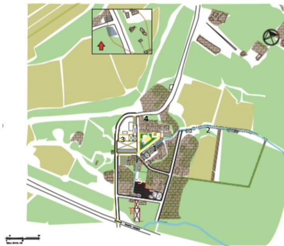
Figura 6. Plano de conjunto actualmente. La simbología es la misma de la Figura 5.

En la figura 5 se puede observar un plano de la Ex hacienda San Nicolás Pantitlán del S.XVII y en la figura 6 uno actual. Como se observa, existen viviendas dentro de lo que era la antigua Hacienda. Actualmente se encuentra sin uso la que antes fuera la casa de los Purgares, mientras que la casa habitación, la casa de Calderas, el molino y las calderas, hoy forman parte de viviendas.