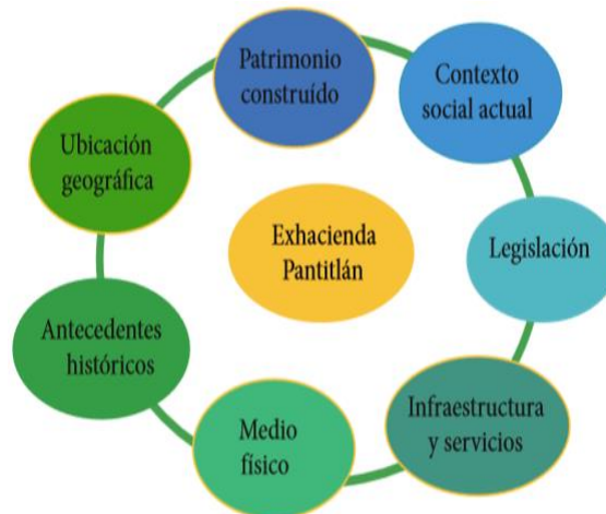
Figura 3. Elementos de la Ex hacienda Pantitlán a estudiar

Para comprender de manera general el sitio de estudio se analizaron distintos campos, que se exponen en el siguiente gráfico (Figura 3); de cada uno de estos campos se hizo un análisis FODA (fortalezas, oportunidades, debilidades y amenazas) y distintas propuestas.