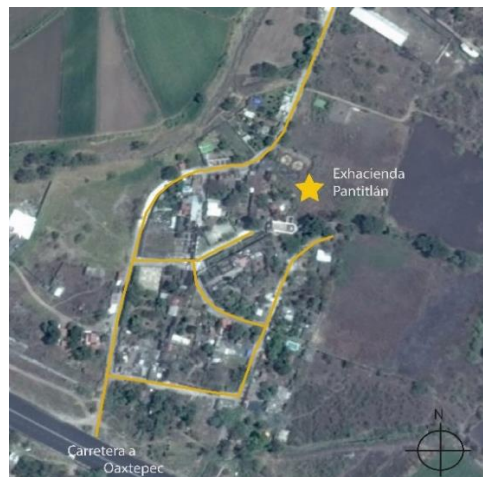
Figura 1. Vista aérea de la colonia Ex hacienda Pantitlán. Plano basado en GoogleEarth.

La Ex hacienda San Nicolás Pantitlán se localiza en los límites territoriales del municipio de Tlayacapan, en el Estado de Morelos. El complejo arquitectónico es el de una hacienda de la industria azucarera y se encuentra inmerso en un entorno rural, una de sus características particulares es que en su interior se gestó la traza urbana de un asentamiento (Figura 1). Esta particularidad del sitio lo hace único, pues los inmuebles tienen gran arraigo entre la población (Figura 2).