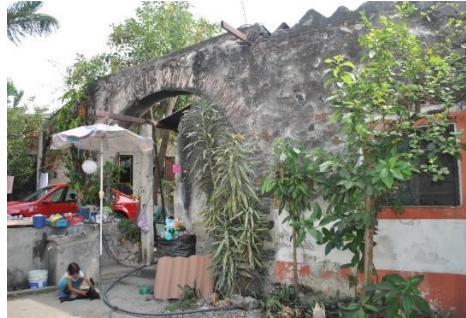
Figura 2. Fotografía de una de las casas que se forman con parte de los muros de la Ex hacienda

Como se mencionó, para la reutilización arquitectónica el campo social es de suma importancia, pues se cree que un inmueble que pueda favorecer la calidad de vida de la población podrá conservarse por más tiempo, a diferencia de otros inmuebles que se restauran y conseguir recursos para su conservación llega a ser una carga para ña población, pues no tienen un vínculo importante con la realidad social donde se insertan.