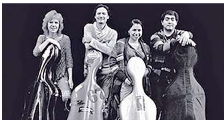
■ Quatricelli ofrecerá la maestría de su música durante la velada de música y museo en el Musa.