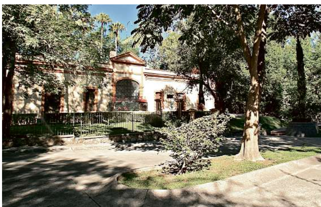
■ La Casa Cultural Colomos tendrá una "manita de gato" por parte de la SC de Guadalajara.